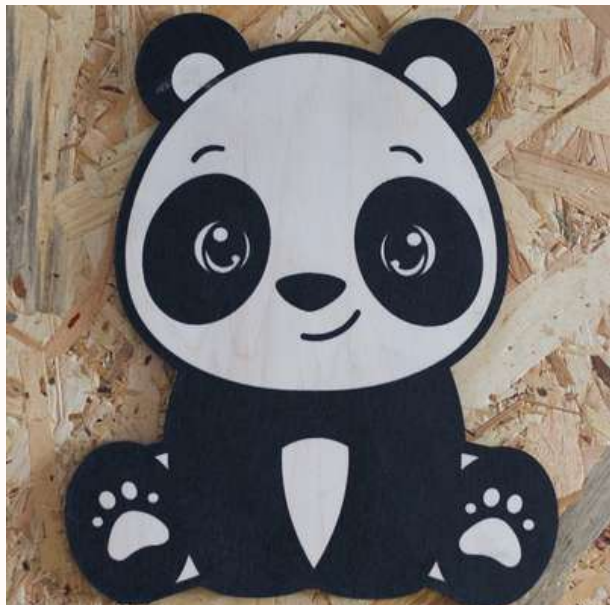
DÉCORATION MURALE PANDA 10€

Un compagnon ludique et bienveillant pour le quotidien des enfants.